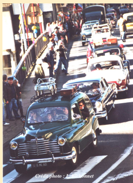
L'événement « Embouteillage des années 50-60 sur la N7 »